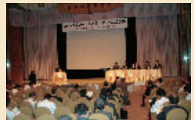
コージェネレーションシンポジウム