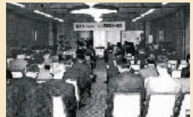
日本コージェネレーション研究会設立総会